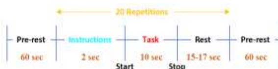
شکل ۱. نمودار شماتیک توالی اخذ سیگنال

مجموعه داده شامل سیگنال‌های EEG و NIRS مبتنی بر تخیل در طول حرکت باز و بسته‌شدن دست راست و چپ است [۴۰، ۴۱]. سیگنال‌های ۲۹ فرد سالم در یک اتاق روشن معمولی ثبت شده‌اند که شامل ۱۴ مرد و ۱۵ زن در محدوده سنی ۲۴،۸ تا ۳۲،۲ سال هستند. هنگام ضبط سیگنال‌های EEG و NIRS، اشخاص راحت هستند و می‌نشینند. آن‌ها یک فلش سیاه را دنبال می‌کنند که در مرکز یک صفحه سفید اشاره می‌کند. فاصله بین اشخاص و صفحه‌نمایش ۱،۶ متر است. هر شخص هر کاری را ۲۰ بار تکرار می‌کند. از آنجایی که در مجموع سه جلسه برگزار می‌شود، برای هر شخص ۶۰ ضبط سیگنال وجود دارد. اطلاعات دقیق در مورد تحقق یک جلسه و مدت‌زمان آن در شکل (۱) ارائه شده است که پارادایم آزمایشی را با جزئیات نشان می‌دهد.